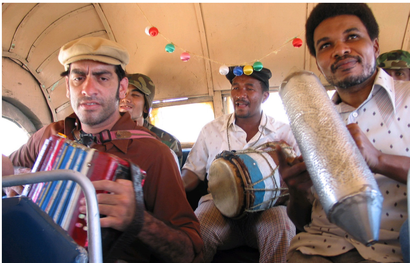
Figura 7. Los personajes de Manuel, Mauricio y Francisco en Perico ripiao .