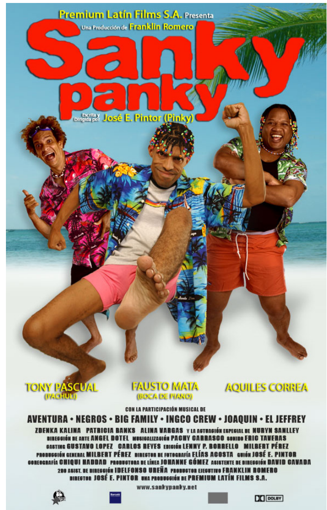
Figura 5. Foto del poster de la película Sanky Panky

710) y cruzar el Canal de la Mona para buscar una mejoría en sus vidas.