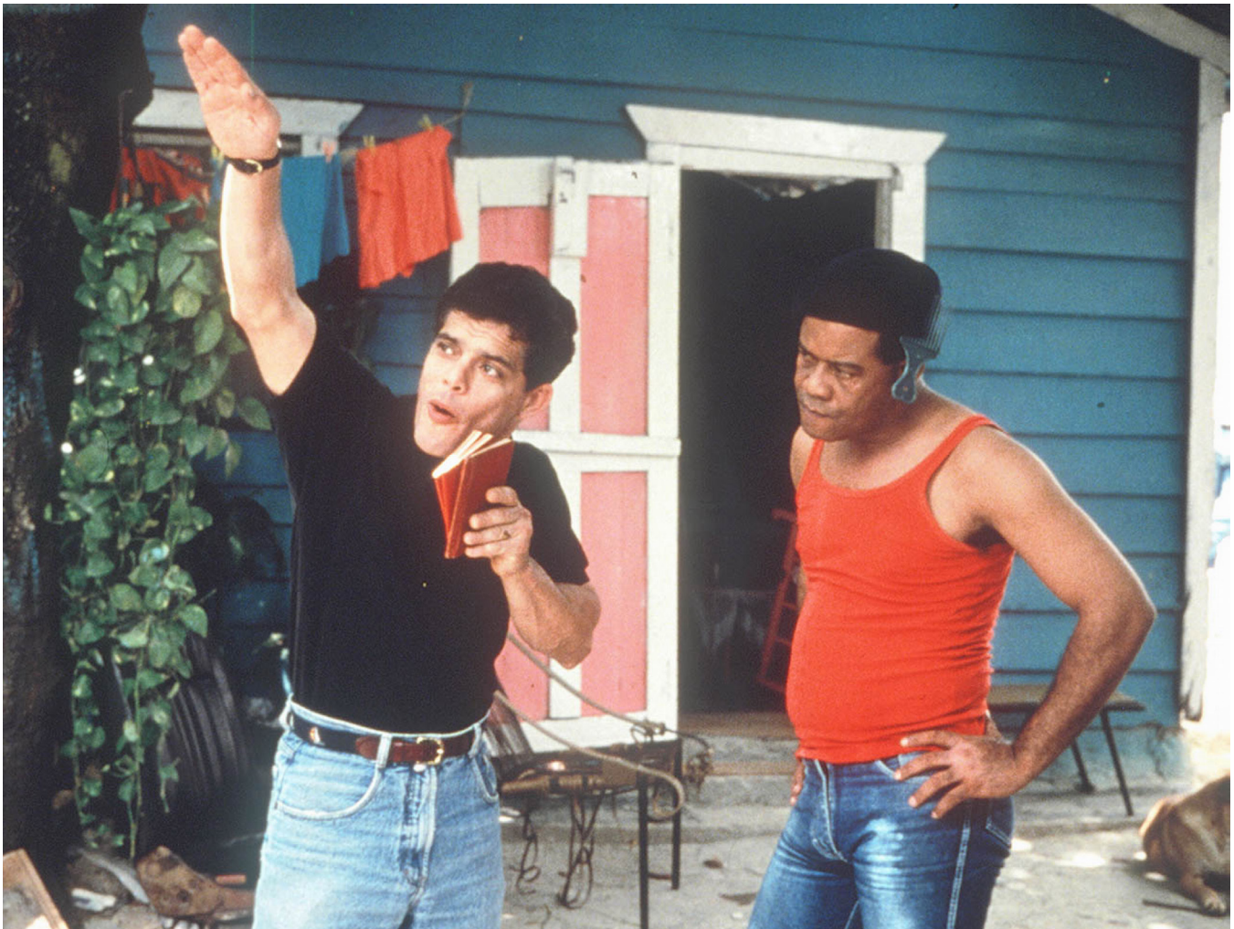
Figura 4. Los personajes de Fellito y Balbuena en Nueba Yol, por fin llegó balbuena .

de migración ilegal, reforzando otros discursos analizados en el cine dominicano. En la primera, el contexto social que da origen al personaje de Balbuena presenta las mejores condiciones para el retrato de un individuo que se muestra inserto dentro de un universo donde la precariedad y la supervivencia son parte sustancial de sus movimientos como ente social.