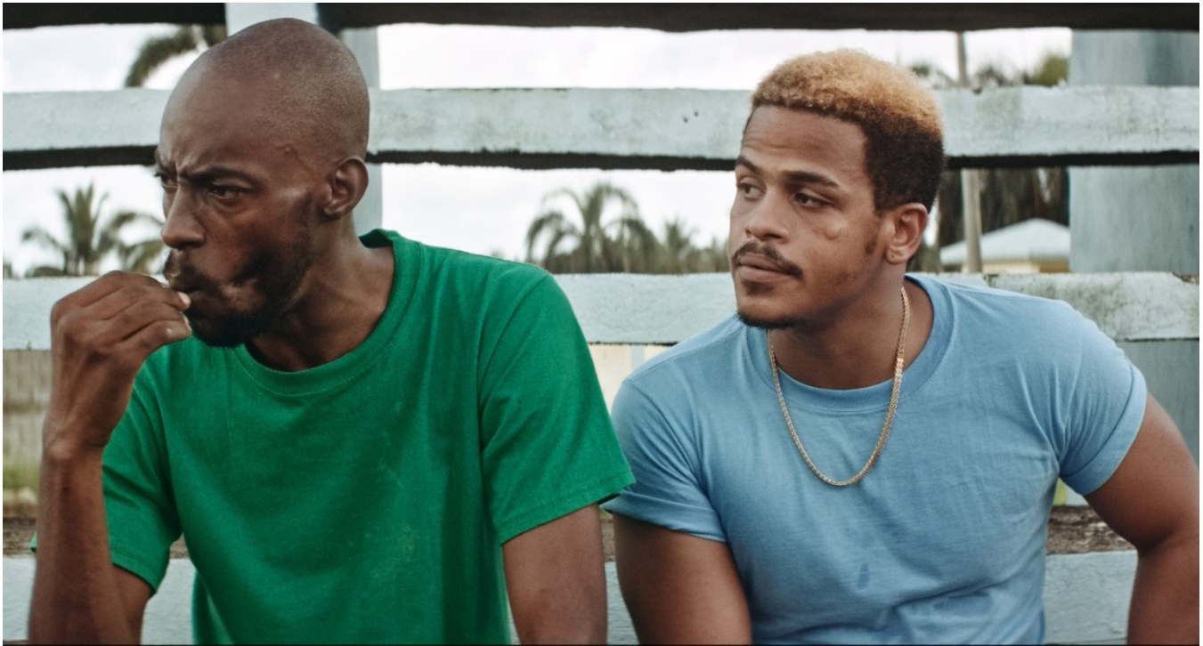
Figura 8. Los personajes de Jualián y Manaury en carpinteros.

películas, las cuales abordan, en distintos tonos, varios de los males presentes en la sociedad dominicana. A través de los personajes de Mauricio, Francisco y Manuel, el autor del filme se concentra en proporcionarles las mejores herramientas para facilitar el discurso donde cada uno de ellos posee una argumentación para poder escaparse y llegar donde sus familiares.