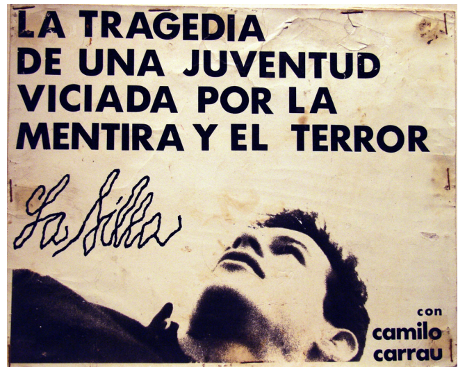
Figura 1. Foto del poster de la película dominicana La silla .

ese momento, en que se vislumbraba la libertad tan esperada” (Sáez, 1982, p.111).